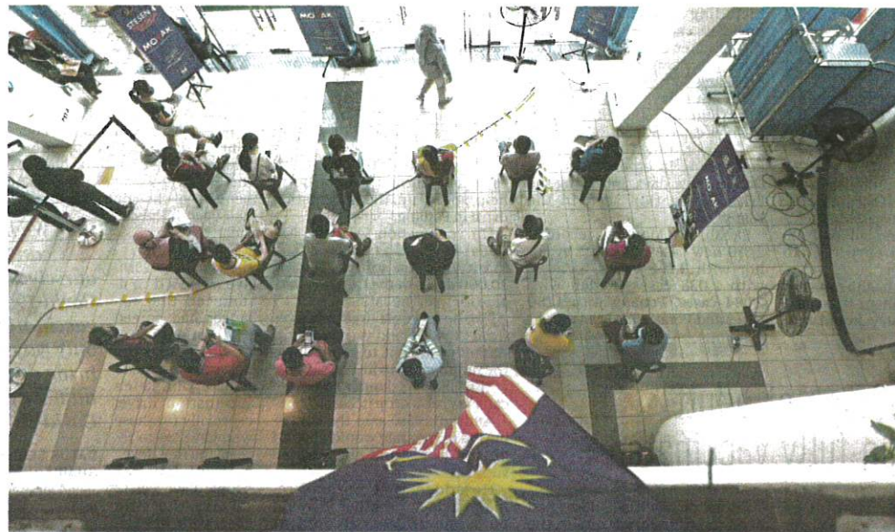
People waiting to get their Covid-19 vaccine shots at Stadium Bandaraya Pulau Pinang in George Town yesterday.

He said the best way to protect oneself was not only to be vaccinated but also to comply with