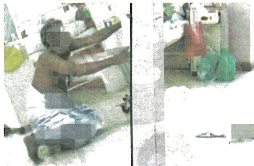
TANGKAP layar video memaparkan keadaan mangsa yang lemah sebelum rebah di lantai wad sebuah hospital di Sungai Petani.

Tambah beliau, pesakit bagaimanapun kelihatan tidak selesa dengan alat bantuan oksigen yang dipakai dan dia kemudian dipantau dengan lebih kerap oleh petugas kesihatan yang boleh bertutur dalam bahasa ibundanya.