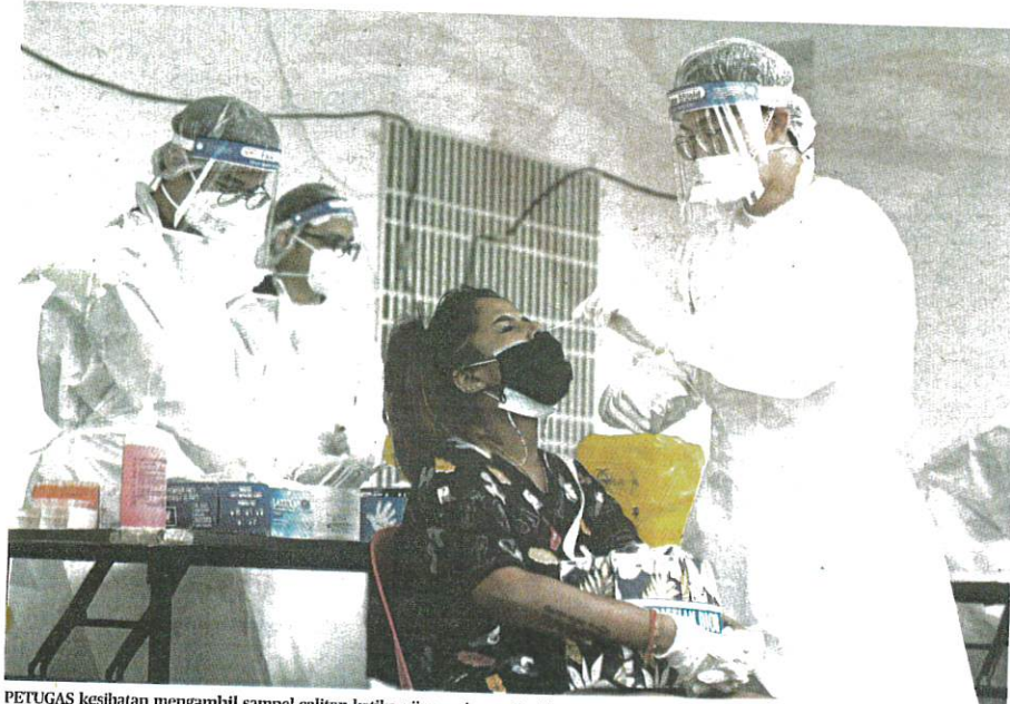
PETUGAS kesihatan mengambil sampel calitan ketika ujian saringan Covid-19 terhadap penduduk di Projek Perumahan Rakyat (PPR) Taman Manggis, Jalan Zainal Abidin, Georgetown, Pulau Pinang, semalam.