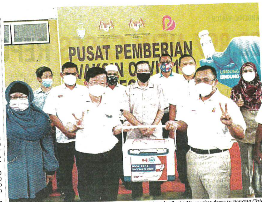
Selangor Menteri Besar Datuk Seri Amirudin Shari presenting the Covid-19 vaccine doses to Penang Chief Minister Chow Kon Yeow at the Seberang Prai Convention Centre vaccination centre in Seberang Jaya yesterday.

Sabah, on Monday, recorded 2,310 new cases, followed by Johor with 2,265 cases, Sarawak with 2,028 cases, Kedah with 2,084 cases, Penang with 1,780 cases and Perak with 1,144 cases.